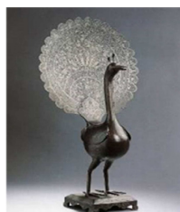
©Paon indo persan, XVIIIe siècle Musée Goya, musée d'art hispanique